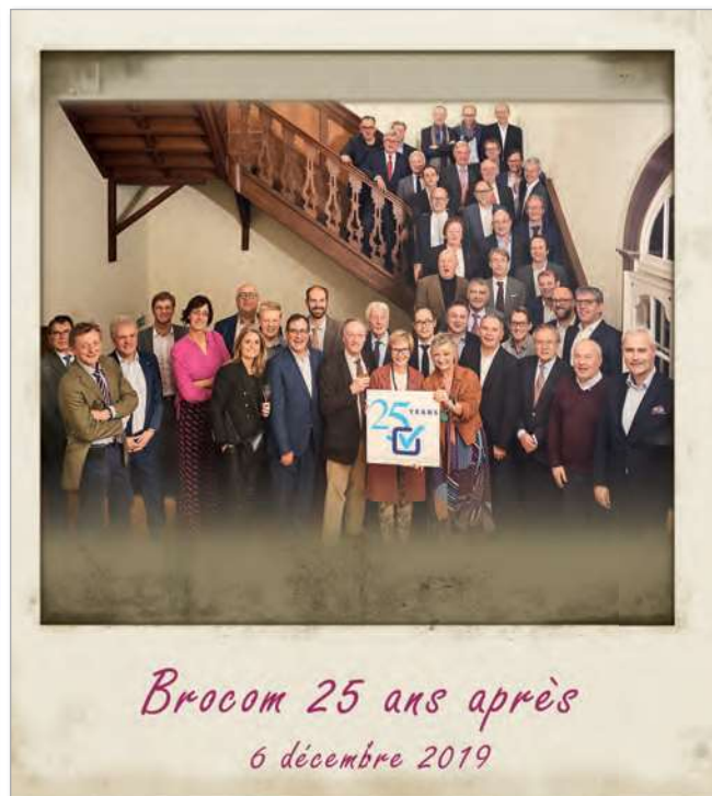
Brocom 25 ans après 6 décembre 2019