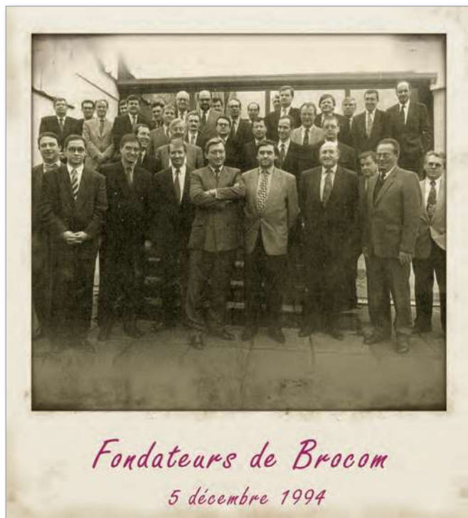
Fondateurs de Brocom 5 décembre 1994